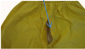
Apertura con bottone in plastica