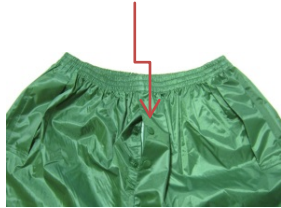
Apertura frontale – 2 bottoni a pressione