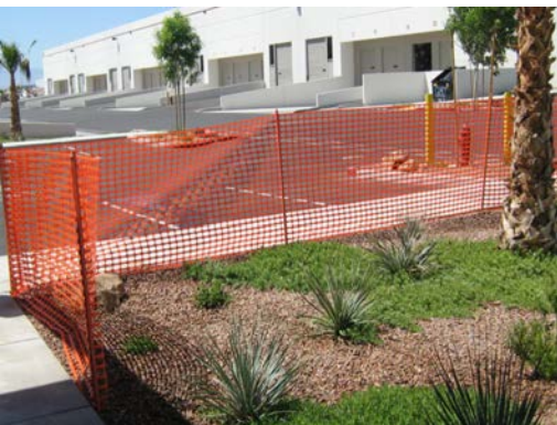
Cantieri arredo urbano, verde pubblico e privato