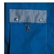
tasca a soffietto con moschettone