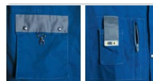
tasca a soffiutto con moschettoni